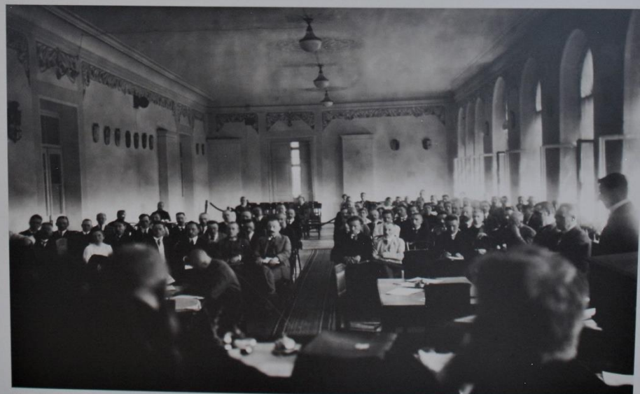
Lietuvos Respublikos Steigiamojo Seimo posėdis

Šaltiniai: Lietuvos Respublikos Prezidentūra, 2014 m. | 140101