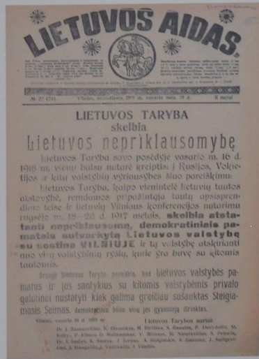
Dienraščio „Lietuvos aidas“ numeris, kuriame pirmą kartą buvo publikuotas Lietuvos Tarybos priimtas Vasario 16-osios Lietuvos Nepriklausomybės Aktas