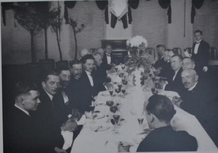
Lietuvos valstybės veikėjų ir užsienio valstybių atstovų vakarienė

Likimas: 1940 m. Sovietų Sąjunga okupavusi Lietuvą patvirtavo įstatymą, 1941 m. gruodžio 16 d. mirė Kaune