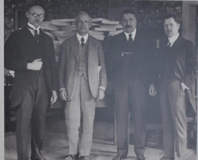
Lietuvos valstybės atstovai prie sąsiuvinį su parašais, kuriais reikalaujama de jure pripažinti Lietuvos valstybę

Likimas: 1942 m. balandžio 1 d. mirė Kaune