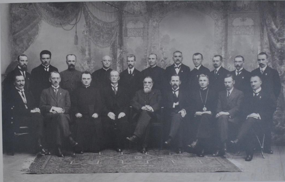
Lietuvių konferencijoje išrinktos Lietuvos Tarybos nariai, 1918 m. vasario 16 d. pasirašė Lietuvos Nepriklausomybės Aktą

Politinis lietuvių branduolys 1918 m. vasario 16 d. istorinėje Lietuvos sostinėje Vilniuje pasirašė Lietuvos Nepriklausomybės Aktą, kuriuo deklaravo dvi didžiausias pamatines Lietuvos valstybės politines vertybes – demokratiją ir parlamentarizmą.