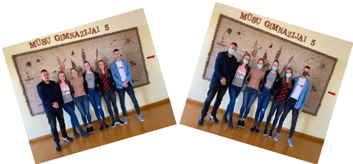
„ŽALIOSIOS OLIMPIADOS“ GIMNAZIJOS KOMANDA