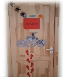
Ig KLASĖ Nominacija: „Jaukiausias“