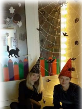
DARŽELIS „BITUTĖ“ Nominacija: „Kūrybingiausias“