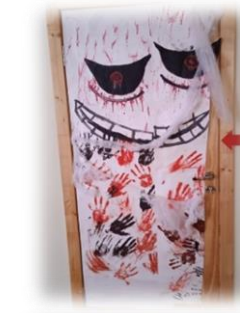
IIIg KLASĖ Nominacija: „Kraupiausias“