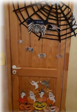
3 KLASĖ Nominacija: „Heloviniškiausias“