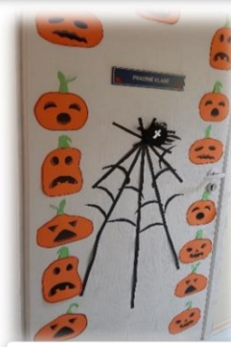
4 KLASĖ Nominacija: „Originaliausias“