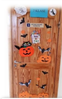
7 KLASĖ Nominacija: „Kūrybingiausias“