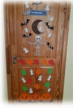
2 KLASĖ Nominacija: „Kukliausias“