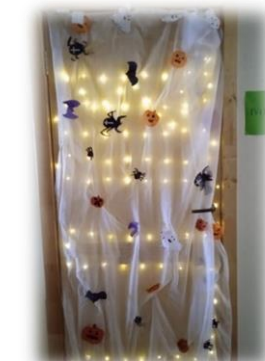
IVg KLASĖ Nominacija: „Kiečiausias“