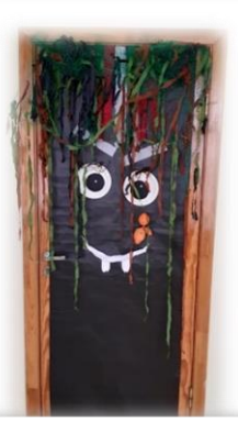
5 KLASĖ Nominacija: „Kūrybingiausias“