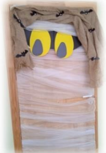
IIg KLASĖ Nominacija: „Jaukiausias“