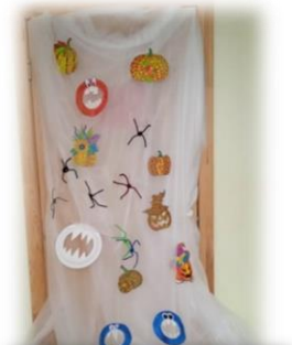
8 KLASĖ Nominacija: „Juokingiausias“