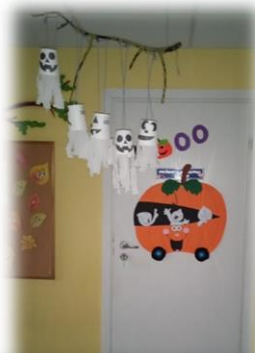
PRIEŠMOKYKLINUKAI Nominacija: „Kūrybingiausias“