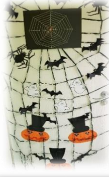
1 KLASĖ Nominacija: „Šmaikščiausias“