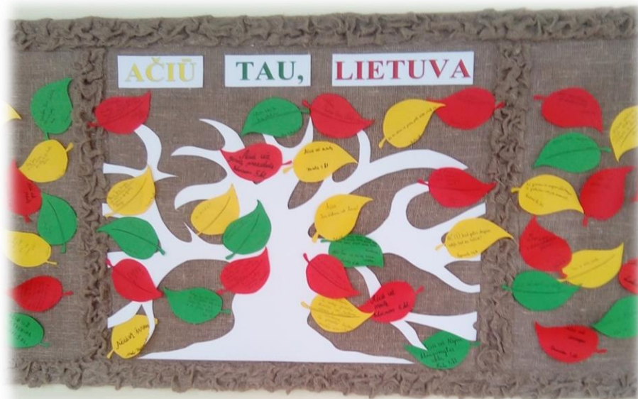
Mūsų gimnazijos mokinių mintys, originaliai sudėtos 1-ojo aukšto stende.