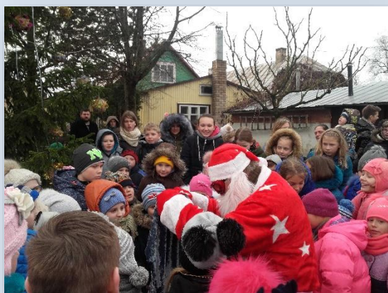
Pradinukai ir jų mokytojos