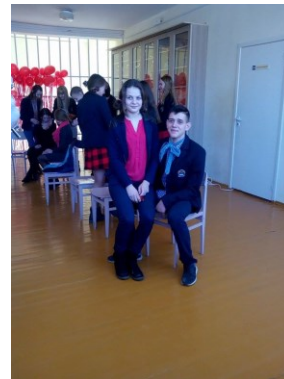
Pati tikriausia meilė tarp sesutės ir brolio