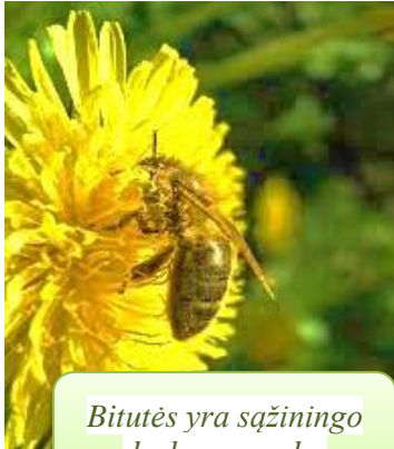
Bitutės yra sąžiningo darbo pavyzdys