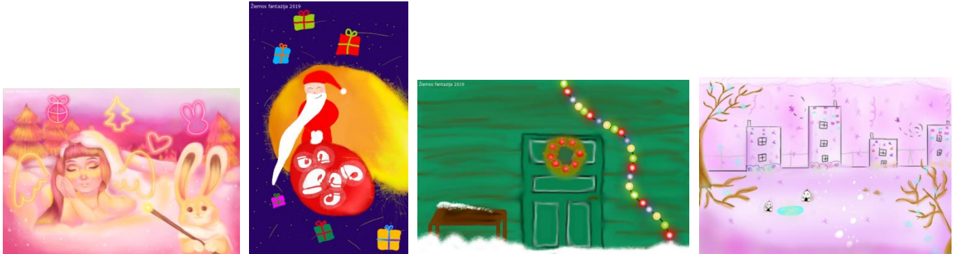
Kornelijos Simonaitytės, Rugilės Aniūnaitės, Vilijos Aniūnaitės ir Guodos Simonaitytės atvirukai

Visus konkurso 4310 dalyvių darbus galite pamatyti puslapyje http://kaledos.nkkm.lt/index.php/atvirukai .