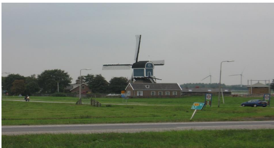
Dar vienas Olandijos simbolis vėjo malūnai.

Visi mėgo kūno kultūrą senojoje mano klasėje, o taip... sportas kaip ir pirmoji vieta Olandijoje. Mėgstamiausias Olandijoje sportas yra futbolas, dar tenisas, rankinis ir plaukimas. Kiekvieną dieną eidavau lauke žaisti futbolo. Ten visi apie sportą kalba teigiamai, Olandija labai garsėja sportu, labiausiai futbolu, esu ir pats lankęs futbolo treniruotes, net ir rimtoje komandoje buvęs. Ir esu dalyvavęs bėgimo 10 km varžybose.