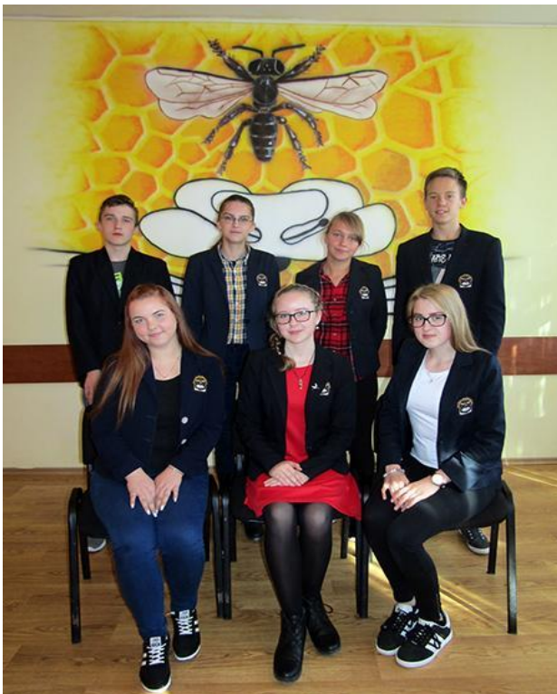
Naujoji mokinių taryba.