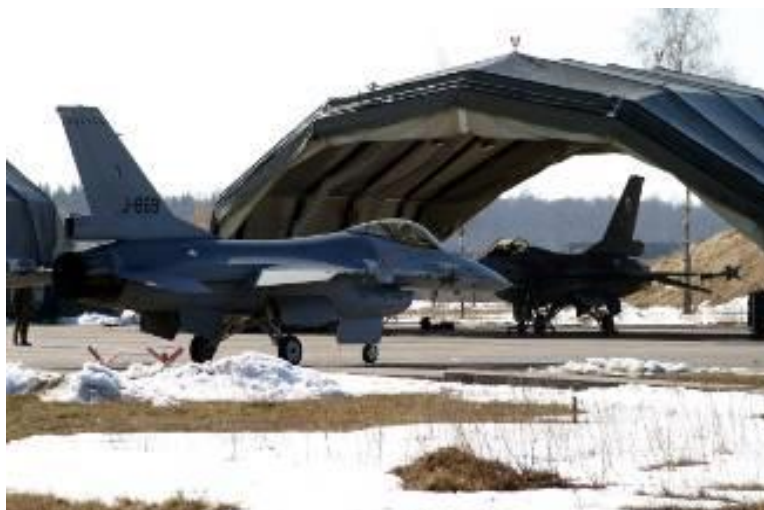
Zoknių oro uostas.

Nors pabuvome ne itin ilgai, kelionė į šią karinių oro pajėgų bazę buvo tikrai įdomi. Tikiu, kad mes visi norime apsilankyti čia dar kartą ir dar daugiau sužinoti.