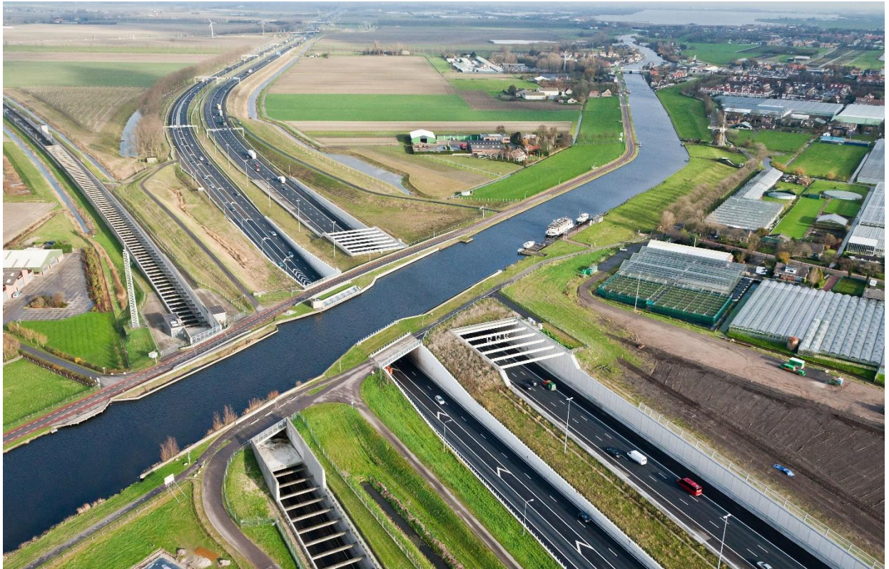
Olandija garsėja savo kanalais.

Ir mokymosi programa daug smagesne, ir daug įdomiau mokintis, kitaip sakant, labiau išaiškina, ką reikia daryti ir aiškus tikslas. Kiekvieną pertrauką reikia būtinai eiti į lauką grynų oru pakvėpuoti, striukės kabinamos prie pat klasės, kiekvienas turi savo stalą, stalias ir kėdė yra nustatyti pagal tavo ūgį, kad tau būtų patogiau sėdėti ir kad tiesiai sėdėtum.