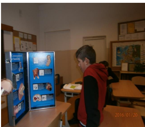
Sveikatos valandėlė 8 klasėje