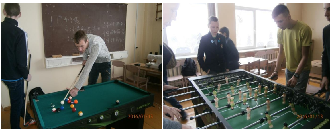
Pertrauka laisvalaikio kambaryje

Gruodžio mėnesio „Vaškinuke“ I klasės gimnazistai rašė apie kuriamą mokykloje laisvalaikio kambarį. Visi džiaugėsi, kad jau pradžia yra, galima pažaisiti, pabūti su draugais. Tačiau norime priminti, kad ir laisvalaikio kambaryje nereikia tiek atsipalaiduoti, kad niokojamos brangios priemonės, vėluojama į pamokas ir pan. Visi kurkime, tausokime tai, kas yra reikalinga, elkimės kultūringai.